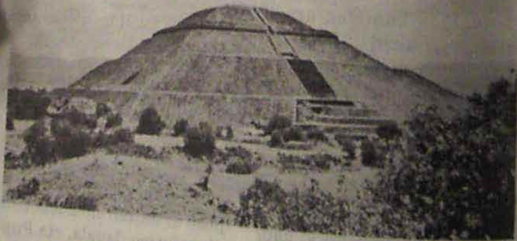
Teotihuacan, Ameriketako piramiderik aundiena.

“Eta Popocatepelt'ek apurtu eban bere belaunetan gezi-txorta, eta, abots sorgorrez, bere arbasoen itzalak biraokatu zituen bere jainko pairu-eziñaren ankerkeria-