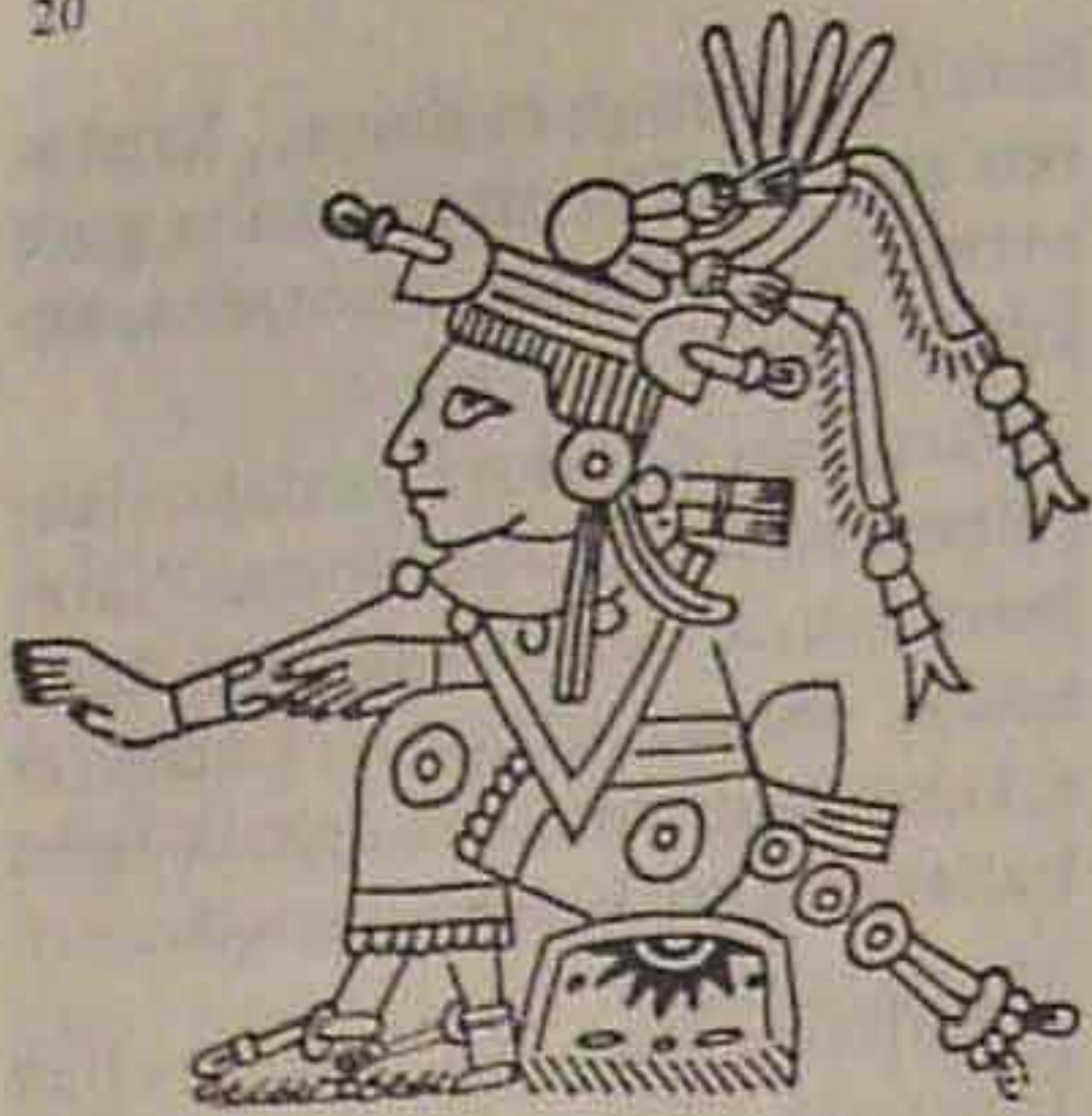
Xochiquetzal, Tlalco jainkoaren emaztea.

bat erdian; beronen aurrez-aurre kokatzen da Illagiaren Zeia, eta sarkalderantz daukazuz Jaguar eta Mitxeleten Jauretxeak.